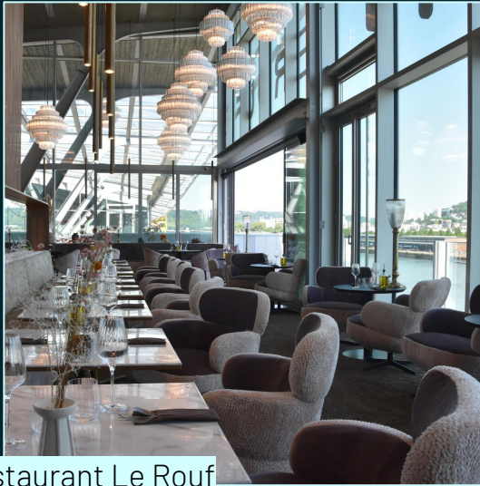
Restaurant Le Rouf