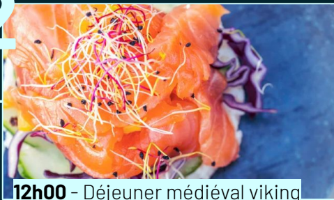
12h00 - Déjeuner médiéval viking