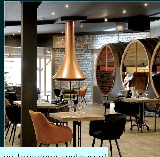
Les tonneaux restaurant