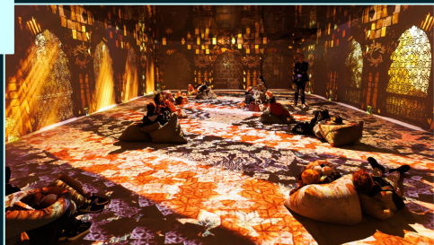
10h30 - Visite de la Cité Immersive Viking