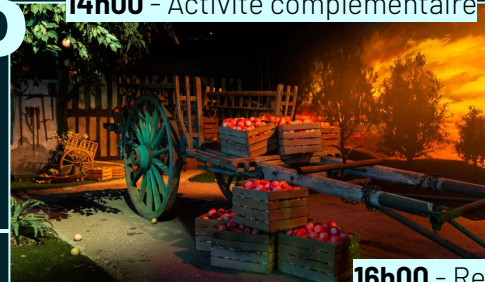
16h00 - Retour